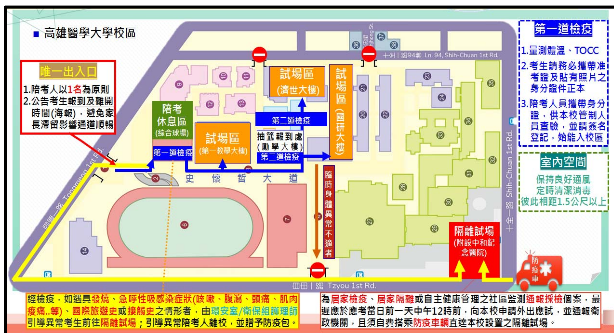
圖一：校園動線平面圖